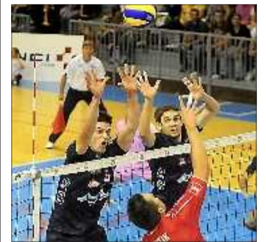
■ Battus deux fois cette saison par le Bouc, les Sétois ont fait mentir le proverbe.