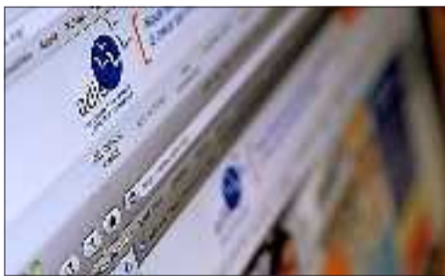
■ L'Adie revendique 13 853 emplois créés en 2011.

Quelques milliers d'euros suffisent parfois à se lancer.